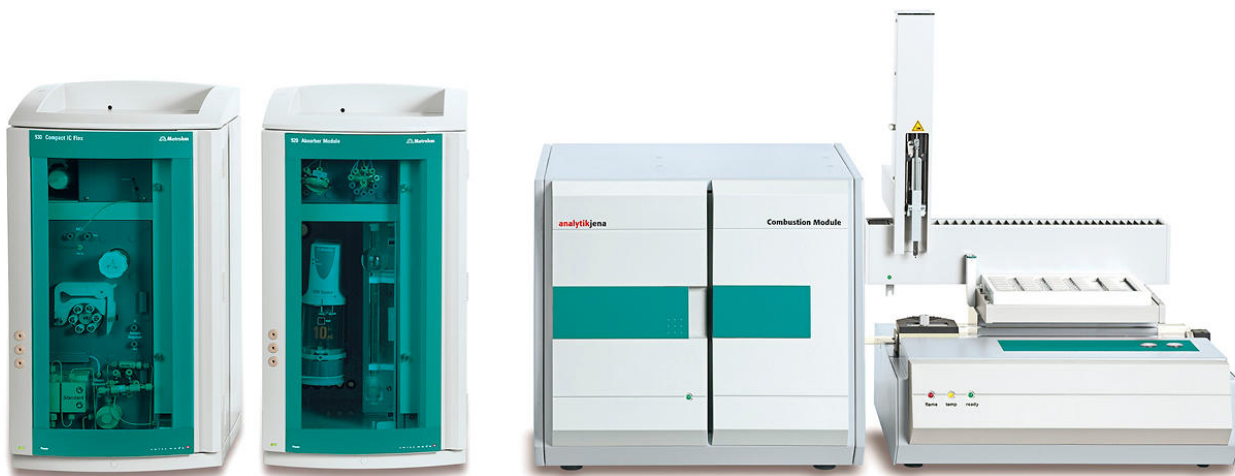
Figure 1. Configuração de CI de combustão consistindo de um CI compacto 930 flex (2.930.2560), um módulo absorvedor 920 (2.920.0010), um módulo de combustão (forno + ABD, 2.136.0700) e um amostrador automático MMS 5000 (2.136.0800) configurado para amostras sólidas (6.7302.000).

O amostrador automático transfere automaticamente os recipientes de amostra para o módulo de combustão, onde são queimados a uma temperatura de 1050 °C. Com o fluxo de gás, o flúor volatilizado (junto com outros halogênios e enxofre) é transferido para o Módulo Absorvedor 920 e absorvido pela fase aquosa. O manuseio preciso e automatizado de líquidos é feito com o Dosinos, transferindo a amostra aquosa para o CI (930 Compact IC flex) para análise. Para manter o fundo e os limites de detecção de flúor baixos, é essencial usar produtos químicos limpos que tenham pelo menos o grau de pureza «por análise».