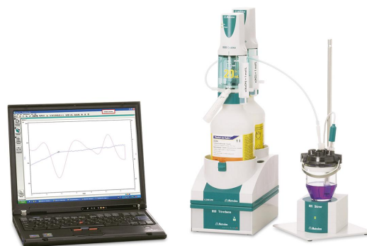
Figure 1. 859温度滴定用のTitrothermセットアップと、ti amoを使用して実行されたデータ評価。

適切な量のサンプルが滴定容器に正確に計量されます。脱イオン水を加えてサンプルを溶解し、標準化されたSTPBの発熱エントポイントに達するまで滴定します。