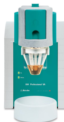
Figure 1. 884 Professional VA manual for MME.

Add 10 mL acetic acid sample and then 2 mL ultrapure water into the measuring vessel. Carry out the determination of iodide using the 884 Professional VA (Figure 1) and the parameters specified in Table 1. The concentration is determined by two additions of iodide standard addition solution.