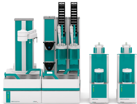
Figure 1. OMNIS Sample Robot S, OMNIS Dosing Module and OMNIS Advanced Titrator equipped with dProfitrode and dAg-Titrode for the determination of chloride content.

This analysis is performed on an automated system consisting of an OMNIS Advanced Titrator and an OMNIS Sample Robot S equipped with a dProfitrode and a dAg-Titrode. Warm water is added to a reasonable amount of sample. For samples with high fat content, some isopropanol is additionally added. The pH is adjusted with nitric acid to below pH 1.5. The sample is titrated with standardized silver nitrate until after the equivalence point. For automated rinsing of electrodes and burets, isopropanol is used.