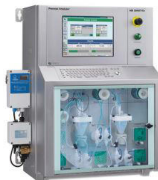
Figure 2. ADI 2045TI Ex proof (ATEX) Analyzer.

Il cloruro viene analizzato con il rilevamento della conducibilità come descritto in ASTM D3230 con ADI 2045TI ADI 2045TI Ex proof Analyzer (Figura 2).