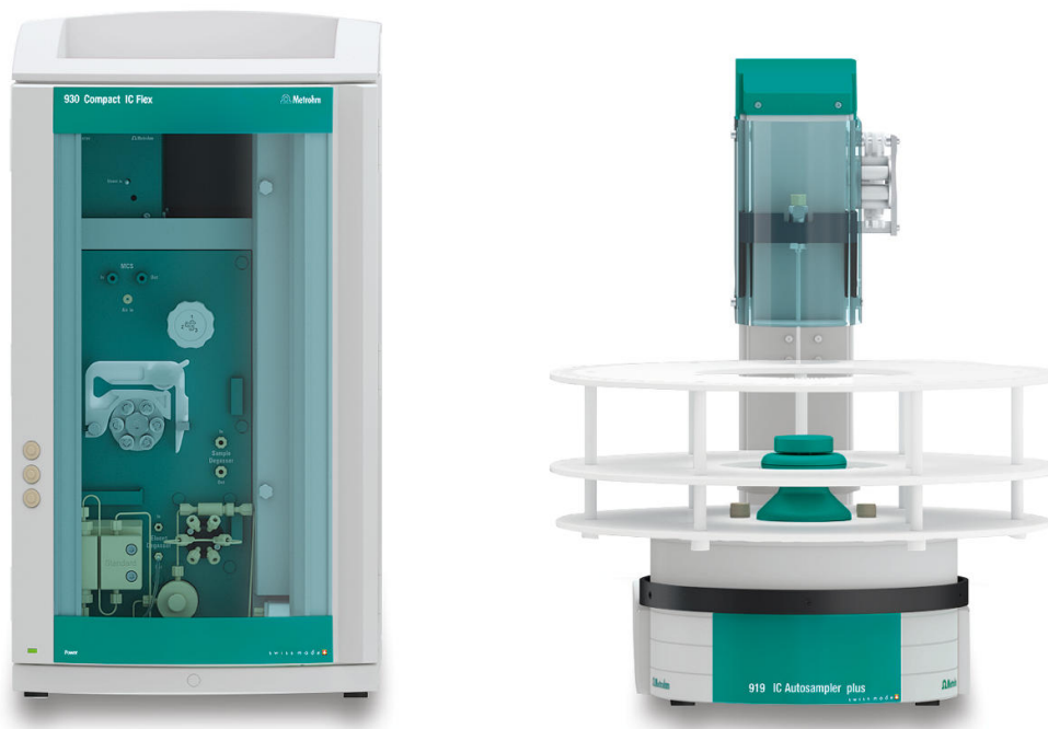
Figure 1. Configurazione strumentale che include un 930 Compact IC Flex con IC Conductivity Detector MB (L) e 919 IC Autosampler plus (R).

composte dai rispettivi sali di sodio. Sono stati utilizzati sali anidri di diversi produttori.