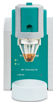
Figure 1. 884 Professional VA manual for MME.

Add 10 mL acetic acid sample and then 2 mL ultrapure water into the measuring vessel. Carry out the determination of iodide using the 884 Professional VA (Figure 1) and the parameters specified in Table 1. The concentration is determined by two additions of iodide standard addition solution.