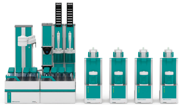
Figure 1. The OMNIS Sample Robot S dotato di un OMNIS Professional Titrator, più una quantità corrispondente di moduli di dosaggio OMNIS per aggiungere tutte le soluzioni necessarie e dPt Titrode er la determinazione automatizzata del valore di iodio.

Una quantità adeguata di campione viene pesata nel bicchiere di titolazione, quindi il bicchiere viene coperto con un coperchio e posizionato sul rack per campioni. Prima della titolazione vengono aggiunti acido acetico glaciale, soluzione di Wijs (ICI) e soluzione di acetato di magnesio e la soluzione viene agitata per cinque minuti. Successivamente si aggiunge una soluzione di ioduro di potassio e la soluzione viene titolata con tiosolfato di sodio standardizzato fino a superare il punto equivalente.