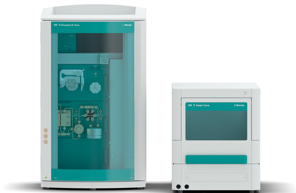
Figure 1. Configurazione strumentale che include un 940 Professional IC Vario ONE/SeS/PP, IC Conductivity Detector (L) e 889 IC Sample Center (R).

stati analizzati con un 940 Professional IC Vario utilizzando i parametri del metodo indicati nella rispettiva monografia USP ( Tabella 1 ).