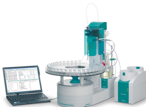
Figura 1. Sistema completamente automatizzato costituito da un 874 Oven Sample Processor con 851 Titrando per il coulometrico Karl Fischer dopo la vaporizzazione dell'eventuale umidità presente nel campione.

prima del campionamento. Dopo l'omogeneizzazione, il campione viene pesato direttamente nella fiala del campione. La dimensione del campione dipende dalla quantità di acqua prevista. Le fiale del campione sono sigillate ermeticamente e posizionate sul rack per campioni.