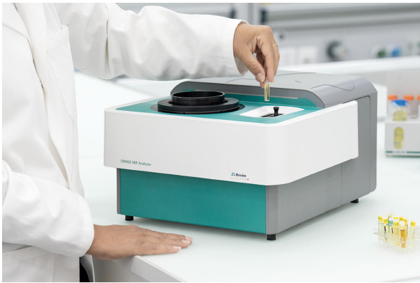
Figure 1. Analyseur NIR OMNIS et un échantillon rempli dans un flacon jetable.

une alternative plus rapide et plus rentable pour la détermination de l'eau dans l'éther méthylique de propylène glycol.