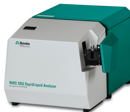
Figure 1. The NIRS XDS RapidLiquid Analyzer with a 1 mm quartz cuvette, used to collect the spectra of surfactant samples.

A total of 37 samples with varying surfactant content were provided by a customer. The Vis-NIR spectra (Figure 2) were acquired on a Metrohm NIRS XDS RapidLiquid Analyzer equipped with 1 mm quartz cuvette (Figure 1). The samples were measured as-is, without any sample preparation steps. Data collection and model development was carried out with the Vision Air complete software package.