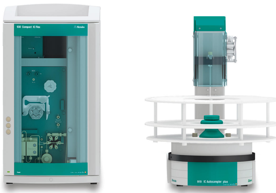
Figure 1. Installation instrumentale comprenant un Compact IC Flex 930 avec le détecteur de conductivité IC MB (G) et le passeur d'échantillons IC 919 plus (D).

sels anhydres provenant de différents fabricants ont été utilisés.