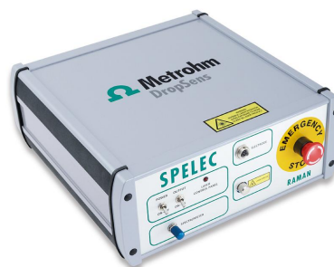
Figure 2. The SPELEC-RAMAN used for the measurements in the application note.

Screen-printed electrodes (refs. DRP-110, DRP-110SWCNT, DRP-110CNT, DRP-110OMC, DRP-110GPH, DRP-110CNF) were placed in a specific cell for this type of devices (DRP-RAMANCELL) coupled with the DRP-RAMANPROBE, which allows to perform the Raman measurements of the electrode surface at optimal focal distance. Integration time was 20 s.