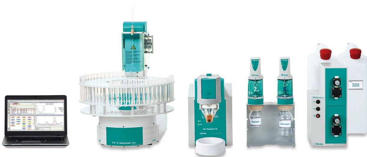
Figure 2. 884 Professional VA, fully automated for VA analysis