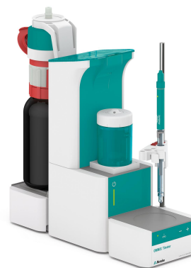
Figure 1. OMNIS Basic Titrator. Example setup for the determination of the pH value.

An aliquot of sample is pipetted into the sample beaker. While stirring, deionized water is added. After stirring for 1 minute, the pH value is measured until a stable drift is reached. Afterwards, the sensors are rinsed with deionized water for cleaning. The Profitrode is then conditioned for 2 minutes by immersing the glass membrane alone in deionized water.