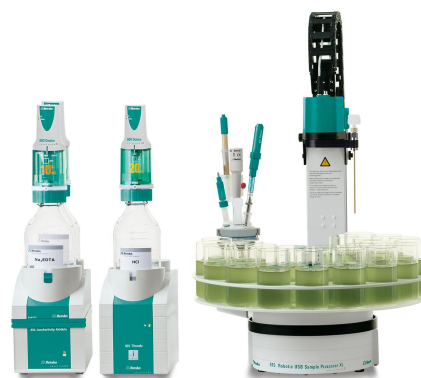
Figure 1. Example system: 815 Robotic USB Sample Processor XL with an external titration vessel, 905 Titrando and 856 Conductivity Module equipped with iAquatrode plus, iAg-Titrode, and 5-ring conductivity measuring cell for the analysis of tap water.

The pH electrode and the conductivity measuring cell are calibrated prior to the analysis.