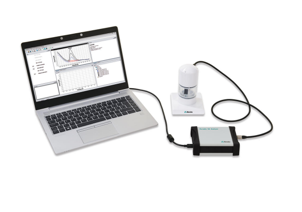
Figure 1. 946 Portable VA Analyzer (scTRACE Gold version)

The scTRACE Gold is electrochemically activated prior to the first determination. In the next step, the water sample and the supporting electrolyte are pipetted into the measuring vessel. The determination is carried out with the 884 Professional VA or with the 946 Portable VA Analyzer using the parameters specified in Table 1 . The concentration is determined by two additions of a standard addition solution.