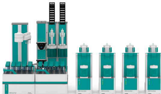
Figure 1. OMNIS Sample Robot S avec fonction Dis-Cover, module de dosage, et OMNIS Advanced Titrator équipé d'une dSolvotrode pour la détermination de l'indice d'acidité et des acides gras libres.

Un mélange de solvants composé d'éthanol et d'éther diéthylique est automatiquement ajouté à une quantité raisonnable d'échantillon et la solution est agitée pendant une minute pour dissoudre l'échantillon. Ensuite, l'échantillon est titré avec de l'hydroxyde de potassium éthanolique normalisé (KOH) jusqu'à ce que le point d'équivalence soit atteint.