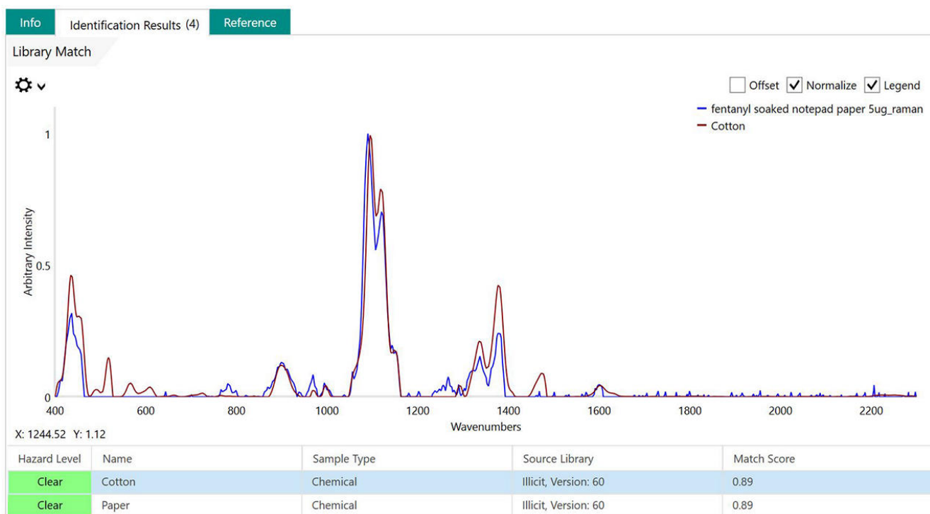
Figure 1. El papel empapado en fentanilo requiere SERS para la detección de rastros, mientras que Raman simplemente identifica el sustrato.

Para demostrar la detección SERS de correo relacionado con drogas ilícitas, este experimento comienza con papel de cuaderno cortado en cuadrados de 0,635 cm (0,25 pulgadas). Se preparó una solución madre de 0,1 mg/mL de fentanilo en metanol y se depositó en estos cuadrados en los siguientes volúmenes: 1 µL, 5 µL, 10 µL, 20 µL y 50 µL para producir 0,1 µg, 0,5 µg, 1 µg, 2 µg y 5 µg de