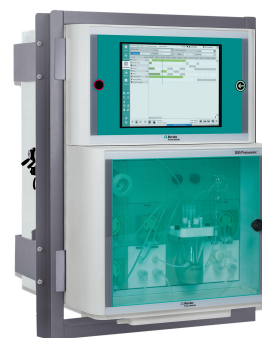
Figure 3. Analizador de procesos 2035.

Además, los sensores de pH en línea se pueden conectar al analizador de procesos 2060 para garantizar un sistema completamente integrado, lo que lleva a un mejor control del proceso.