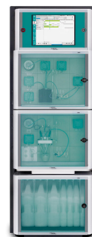
Figure 2. Analizador de procesos 2060.

Para extraer los compuestos adecuados, mantener el pH dentro de las especificaciones y preparar los mismos sabores en múltiples lotes, tanto la alcalinidad como la dureza del proceso y el agua de reposición deben controlarse y mantenerse en los niveles adecuados. Los analizadores de procesos Metrohm Process Analytics 2060 y 2035 ( Figuras 2 y 3 ) son ideales para la ejecución totalmente automática de estos importantes análisis, así como parámetros adicionales como el pH o la conductividad. El analizador de procesos puede enviar una alarma al sistema de control de la planta si los niveles de alcalinidad o dureza no son óptimos, indicando al control de distribución que corrija la química del agua, asegurando una calidad constante del producto.