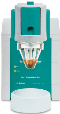
Figure 1. 884 Manual profesional VA para MME.

La muestra de lfp se pesa, se mezcla con ácido sulfúrico diluido desgasificado, se calienta a 85 °C durante 15 minutos y luego se enfría. Luego, la solución de muestra digerida se agrega al recipiente de medición que contiene 20 ml de electrolito desgasificado. La cuantificación se realiza mediante dos adiciones estándar con soluciones separadas de Fe(II) y Fe(III).