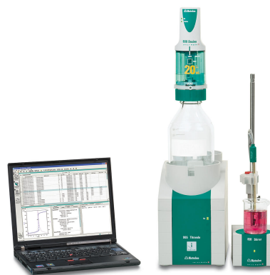
Figure 1. 907 Titrand with tiamo. Configuración ejemplar para la determinación fotométrica de la pureza del sulfato de zinc.

Se pesa una cantidad adecuada de muestra en un vaso de precipitados y se disuelve en agua desionizada. Luego se agrega al vaso de precipitados tampón de amoníaco pH 10 y una pequeña cantidad de indicador Eriochrome Black T. La muestra se titula fotométricamente con EDTA estandarizado hasta después del punto de ruptura.