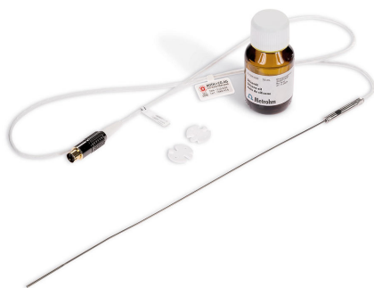
Juego de accesorios para la determinación de la corrección de temperatura en Biodiesel Rancimat. Set para el ajuste exacto de la temperatura