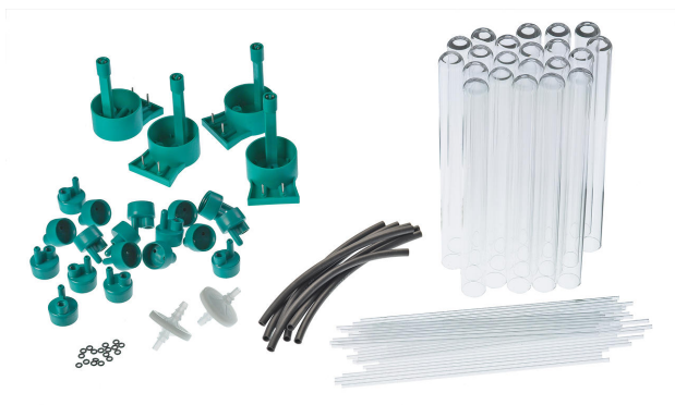
Consumable Kit Biodiesel Rancimat Contiene las piezas de desgaste más importantes para el Biodiesel Rancimat.