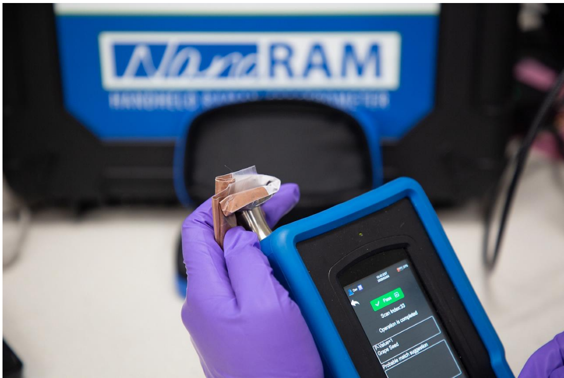
Figure 2. Análisis de extracto de semilla de uva con láser de 1064 nm con adaptador point and shoot.

muestras de colores más oscuros. Para este estudio de caso, se utilizó el modo de identificación NanoRam-1064 porque proporciona un algoritmo robusto basado en un método multivariante. Para cada muestra botánica se creó un método individual. Para crear un método, cada muestra se escaneó cinco veces diferentes en puntos alternos. Todas las muestras se probaron contra cada método para probar la validez.