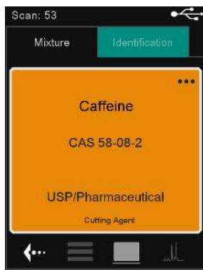
Figure 2. Captura de pantalla real de identificación de cafeína en Yaba con MIRA DS. La cafeína es una sustancia química comúnmente asociada con las drogas ilícitas. El fondo de advertencia amarillo proporciona información inmediata y procesable sobre la naturaleza de la muestra.