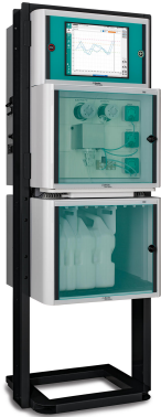
Figure 3. Analizador de procesos 2060 VA de Metrohm Process Analytics.

completamente automatizados, lo que garantiza eficiencia y precisión. Este método demuestra su resiliencia en diversas matrices de muestras, incluida agua altamente salina.