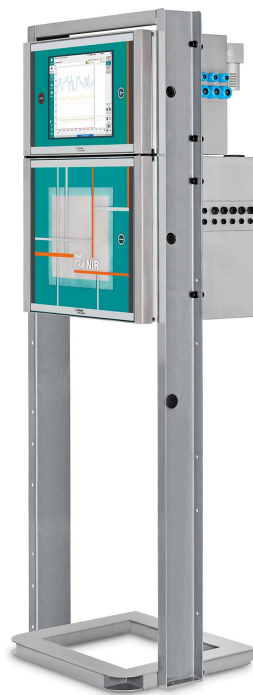
Figure 3. 2060 El analizador NIR de Metrohm Process Analytics.