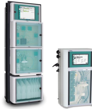
Figure 3. Algunos de los analizadores de Metrohm Process Analytics capaces de determinar la concentración de amoníaco en línea. Izquierda: 2060 Process Analyzer, derecha: 2026 Titrolyzer.

calderas, calcio y sulfato en el proceso de desulfuración de gases de combustión, ácido bórico en agua de refrigeración, reactores de agua a presión (PWR), mediciones de ultratrazas de hierro (Fe) y Cu, concentración de amina rica/pobre y CO 2 capturados en Plantas de Captura de Carbono, y muchos más.