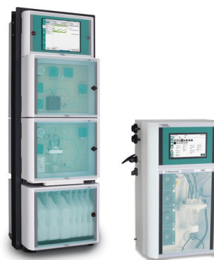
Figure 3. Algunos de los analizadores de Metrohm Process Analytics capaces de determinar la concentración de amoníaco en línea. Izquierda: 2060 Process Analyzer, derecha: 2026 Titrolyzer.