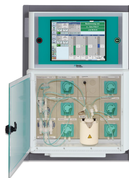
Figure 2. El analizador de procesos 2035 TP de Metrohm Process Analytics.

fotómetro de cubeta de digestión. Se pueden conectar varios flujos de muestra al analizador 2035 TP, lo que permite un control completo sobre el proceso de tratamiento de fósforo. El analizador puede enviar alarmas para concentraciones máximas, guardar bacterias o notificaciones si se exceden los límites reglamentarios.