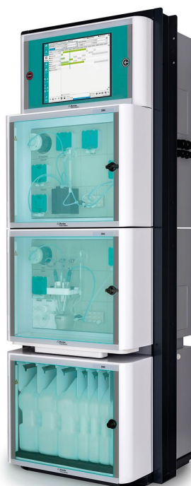
Figure 3. 2060 TI Process Analyzer de Metrohm Process Analytics.