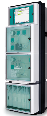
Figure 2. 2060 Process Analyzer para mediciones fotométricas de ultratrazas de hierro y cobre en el circuito agua-vapor de centrales eléctricas.

El análisis continuo de ultratrazas en línea de Fe y Cu en el circuito de agua-vapor de las centrales eléctricas es posible utilizando el Analizador de procesos 2060 (Figura 2) de Metrohm Process Analytics. Este sistema automatizado de análisis de procesos permite la detección temprana de picos y procesos de corrosión, y también monitorea la formación y destrucción de la capa protectora de óxido (figura 3). Los análisis continuos también señalan un problema antes de que los metales disueltos puedan llegar a la corriente de condensado y, por lo tanto, a las palas de la turbina, donde podrían causar daños. En combinación con el Sistema de control distribuido (DCS) de la planta de energía, el monitoreo en línea de Fe y Cu garantiza que la corrosión se pueda controlar antes de que afecte la eficiencia de la planta de energía, lo que en última instancia reduce el tiempo de inactividad y los costos de mantenimiento.