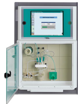
Figure 3. Analizador de procesos 2035: potenciométrico para la determinación precisa de TMAH en el revelador.

los Analizador de procesos 2035 configurado para titulación potenciométrica realiza el análisis preciso de TMAH en línea utilizando un electrodo de pH combinado. La dosificación precisa de TMAH en la solución de revelador por parte del analizador también es una posibilidad para garantizar una concentración estable para cada lote.