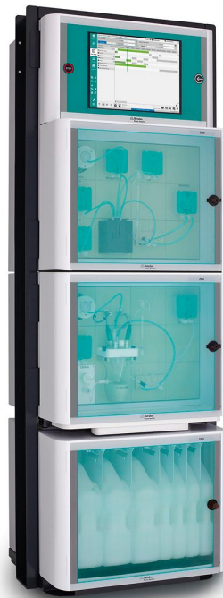
Figure 2. 2060 TI Process Analyzer para el análisis en línea de parámetros críticos de calidad en baños de decapado mediante el método de valoración.

productos químicos se reducen considerablemente. Metrohm Process Analytics ofrece un analizador de procesos multiparamétrico adecuado para el análisis simultáneo de Fe^{2+}/Fe^{3+} y de la relación ácido libre/ácido total en un amplio rango de concentraciones: el analizador de procesos 2060 TI (figura 2).