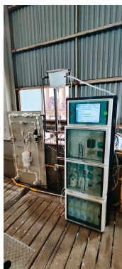
Figure 2. Analizador de Procesos 2060 TI con panel de preacondicionamiento en planta de refinación de zinc.

concentraciones: el Analizador de procesos 2060 TI (Figura 2). Con este analizador de procesos se pueden realizar otras combinaciones de mediciones (p. ej., pH), así como puntos de medición tomados de múltiples corrientes.