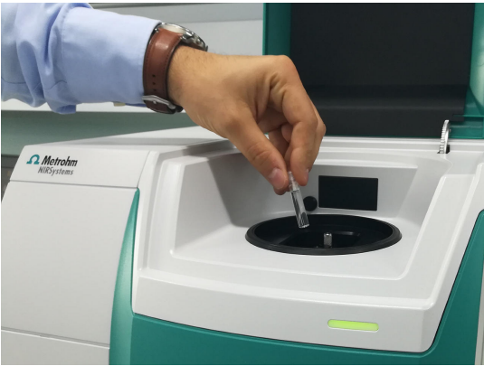
Figure 1. Analizador de líquidos DS2500 y una muestra en un vial desechable.

Se midieron 17 muestras de tres aceites portadores de CBD diferentes (aceite de cánamo, pescado y MCT (triglicéridos de cadena media)) en modo de transmisión con un analizador de líquidos DS2500. El control de temperatura incorporado se ajustó a 40 °C para adquirir espectros reproducibles. Por conveniencia, se utilizaron viales desechables con una longitud de paso de 8 mm, lo que hizo innecesaria la limpieza de los recipientes de muestra. El paquete de software Metrohm Vision Air Complete se utilizó para toda la adquisición de datos y el desarrollo del modelo de predicción.