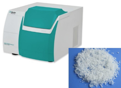
Figure 1. Se utilizó el analizador de sólidos DS2500 para recopilar los espectros del polímero de PVA.

Se recopilaron 54 espectros de 18 lotes de muestras diferentes utilizando un analizador de sólidos Metrohm DS2500 en combinación con el software de espectroscopia Vision Air Complete. Para superar la falta de homogeneidad de la muestra, la medición se realizó con una copa de muestra grande en rotación. Los valores de referencia se obtuvieron por titulación. La detección de valores atípicos se realizó en espectros preprocesados ( 2^{\text{Dakota del Norte}} derivada) usando una distancia máxima en el algoritmo del espacio de longitud de onda. El modelo de predicción NIRS se creó con la configuración descrita en la siguiente tabla y se validó mediante validación cruzada.