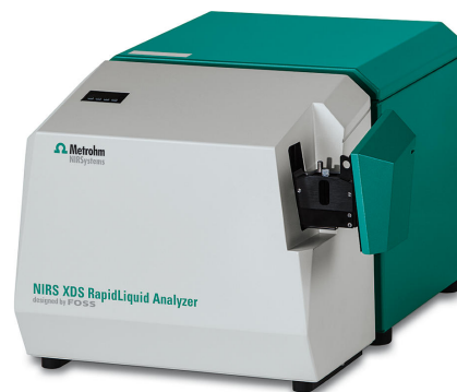
Figure 1. El analizador NIRS XDS RapidLiquid con una cubeta de cuarzo de 1 mm, utilizado para recolectar los espectros de muestras de surfactante.

Un cliente proporcionó un total de 37 muestras con distintos contenidos de surfactante. Los espectros Vis-NIR ( Figura 2 ) se adquirieron en un analizador Metrohm NIRS XDS RapidLiquid equipado con una cubeta de cuarzo de 1 mm ( Figura 1 ). Las muestras se midieron tal cual, sin ningún paso de preparación de muestra. La recopilación de datos y el desarrollo del modelo se realizó con el paquete de software completo Vision Air.