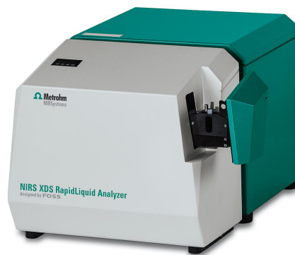
Figure 1. El analizador NIRS XDS RapidLiquid con una cubeta de cuarzo de 1 mm, utilizado para recopilar los espectros de muestras de surfactantes.

Un cliente proporcionó un total de 37 muestras con diferentes contenidos de tensioactivos. Los espectros Vis-NIR ( Figura 2 ) se adquirieron en un Metrohm NIRS XDS RapidLiquid Analyzer equipado con una cubeta de cuarzo de 1 mm ( Figura 1 ). Las muestras se midieron tal cual, sin ningún paso de preparación de muestras. La recopilación de datos y el desarrollo del modelo se llevaron a cabo con el paquete de software completo Vision Air.