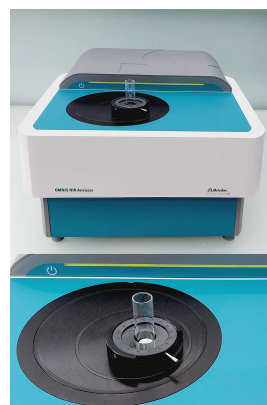
Figure 1. OMNIS NIR Analyzer Solid with 15 mm vial and Flexible holder OMNIS NIR.

En este estudio, se midieron 17 comprimidos de paracetamol con actividad acuosa variable (0,23-0,85 a_w ) en un analizador OMNIS NIR (Figura 1) para crear un modelo de predicción para la cuantificación. Las muestras se midieron en modo de reflexión (1000-2250 nm) en viales de 15 mm utilizando un soporte flexible y un sistema de medición de punto único. Los valores de referencia se midieron según la norma USP<922> de actividad acuosa. [3].