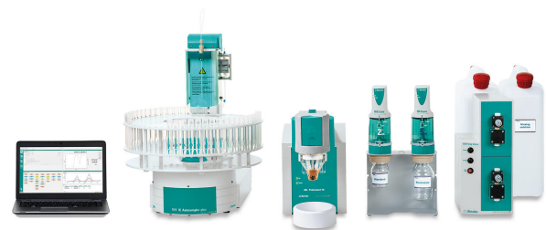
Figure 1. 884 Professional VA, totalmente automatizado para análisis voltamétrico.

Agregue agua, la muestra del bano de revestimiento de Ni no electrolítico y el electrolito de soporte al recipiente de medición. La determinación de bismuto se realiza con el 884 Professional VA (Figura 1) utilizando los parámetros especificados en tabla 1. La concentración se determina mediante dos adiciones de una solución de adición estándar de bismuto. El scTRACE Gold se activa electroquímicamente antes de la primera determinación.