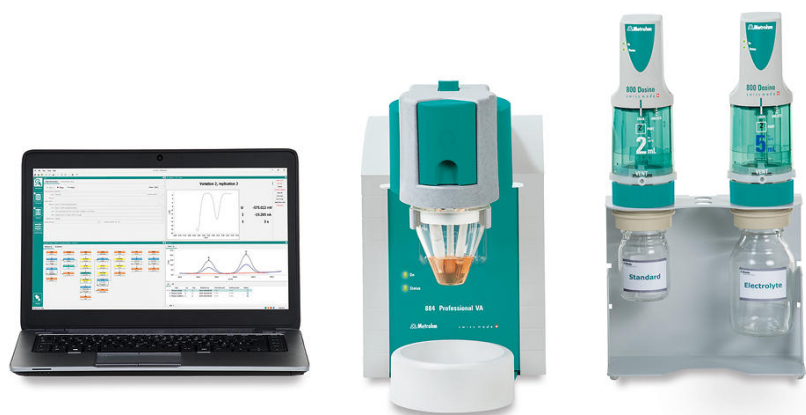
Figure 2. 884 Professional VA, semiautomatizado para análisis de AV