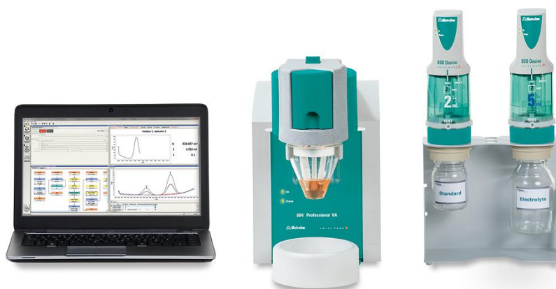
Figure 2. 884 Professional VA, semiautomatizado para análisis de AV