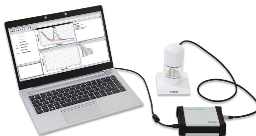
Figure 1. Analizador portátil de AV 946 (SPE)

Antes de la primera determinación, se deposita una película de bismuto ex situ a partir de una solución de Bi. En el siguiente paso, los electrodos se limpian con agua ultrapura y se elimina la solución de bismuto. La muestra de agua se coloca en el recipiente de medición. Se añade tampón amoníaco/cloruro de amonio junto con el agente complejante (dimetilgloxima), y se realiza la determinación simultánea de níquel y cobalto utilizando los parámetros especificados en tabla 1 . La concentración se determina mediante dos adiciones de una solución estándar de adición de níquel y cobalto.