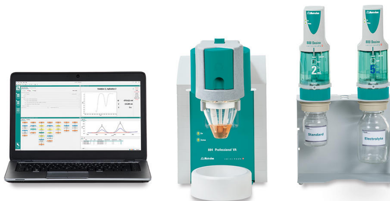
Figure 2. 884 Professional VA semiautomatizado