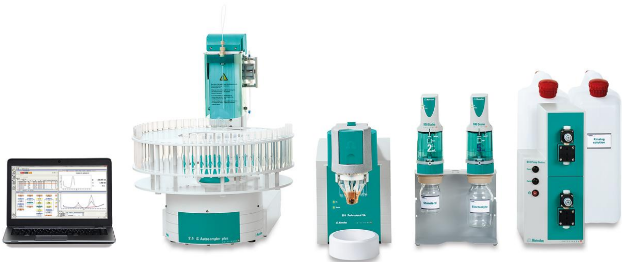
Figure 2. 884 Professional VA, completamente automatizado para el análisis de AV