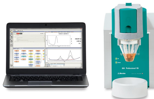
Figure 1. 884 VA profesional.

Después de diluir la muestra en electrolito de soporte, la determinación voltamperométrica de antimonio y bismuto se lleva a cabo en el 884 Professional VA con el Multi-Mode Electrode pro como electrodo de trabajo utilizando los parámetros enumerados en tabla 1 . La concentración se determina mediante dos adiciones de solución estándar de adición de antimonio y bismuto.