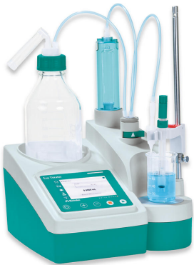
Figure 1. Eco Titrator equipado con un Unitrode con Pt1000 integrado.

Se pipetea una cantidad adecuada de muestra en el vaso de titulación y luego se anaden agua desionizada y cloruro de sodio. Posteriormente, la solución se titula hasta después del tercer criterio de valoración con hidróxido de sodio estandarizado.