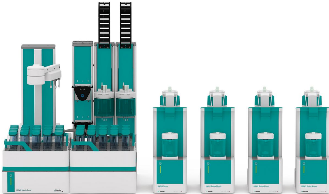
Figure 1. OMNIS Robot S con Discover y análisis paralelo.

OMNIS automatiza todo el proceso de análisis con: