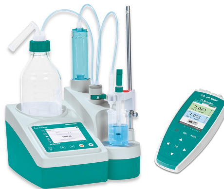
Figure 1. Titador Eco y pHmetro 913 con Gel Ecotrode sin mantenimiento con NTC.

Para la medición de TTA, la solución se titula hasta que se alcanza el primer punto de equivalencia con solución de hidróxido de sodio estandarizada.