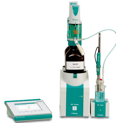
Figure 1. Ejemplo de un sistema Titrande compuesto por un 905 Titrande y un 900 Touch Control. Alternativamente, el 905 Titrande también se puede conectar a una PC y controlar por tiamo.

El análisis se realiza automáticamente en un sistema Titrande que consiste en un 905 Titrande. El Unitrode se utiliza para la indicación de la curva de titulación. La muestra preparada se titula potenciométricamente frente a ácido sulfúrico estandarizado hasta después del primer punto de equivalencia.