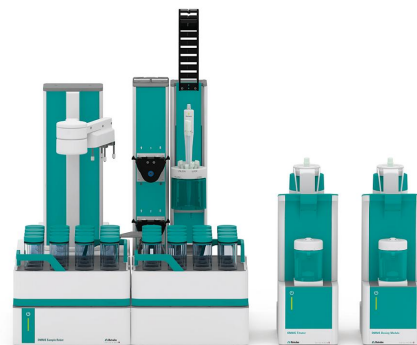
Figure 1. Sistema OMNIS totalmente automatizado para la determinación del índice de acidez en aceites comestibles.

A una cantidad razonable de muestra, se agrega automáticamente una mezcla de solventes que consta de etanol y éter dietílico, y la solución se agita durante un minuto para disolver la muestra. Posteriormente, la muestra se titula con KOH etanólico estandarizado hasta después del punto de equivalencia.