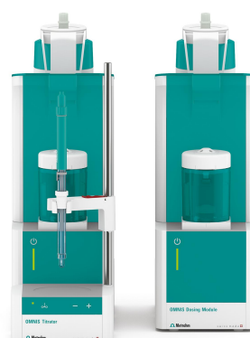
Figure 1. Titulador OMNIS con el electrodo de pH digital y un módulo de dosificación OMNIS.

Metrohm: Titular la muestra directamente con 0,1 mol/L Solución de HCl hasta después del primer punto de equivalencia (EP).